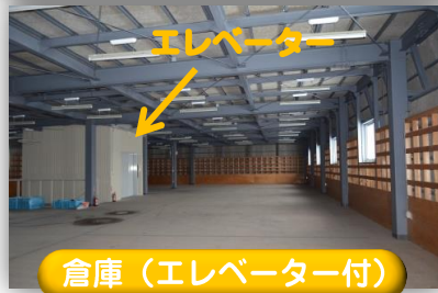
倉庫 (エレベーター付)