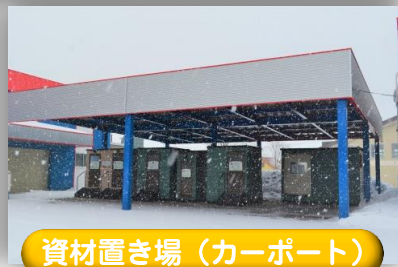
資材置き場 (カーポート)